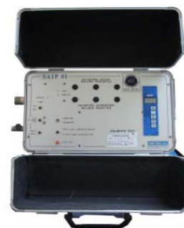
Системы анализа газов настольные, переносные, для окружающей среды, специально разработанные.