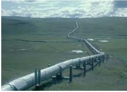
Нефть и газ на суше