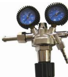
Редукторы давления первой и второй ступени также для высоких скоростей потока.