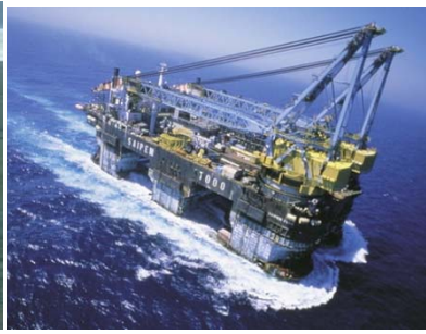
Нефть и газ на шельфе