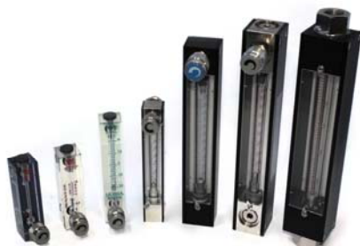
Расходомеры с различными функциями, специально разработанные.