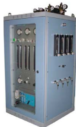
Sistemi di miscelazione analogici anche personalizzati.