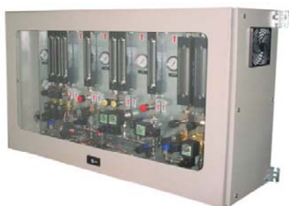
Ingegnerizzazione di skid, sistemi per i trattamenti termici e applicazioni speciali.