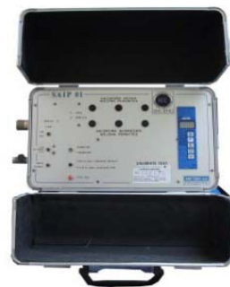
Sistemi di analisi gas da banco, portatili, ambientali e progettati ad hoc.