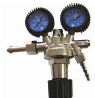
Riduttori di pressione di primo e di secondo stadio anche per alte portate.