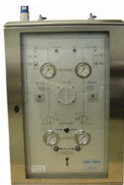
Sistemi di decompressione automatici e semiautomatici.