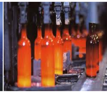
Impianti di lavorazione del vetro