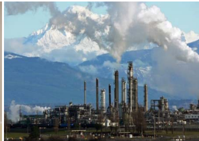
Impianti chimici e raffinerie