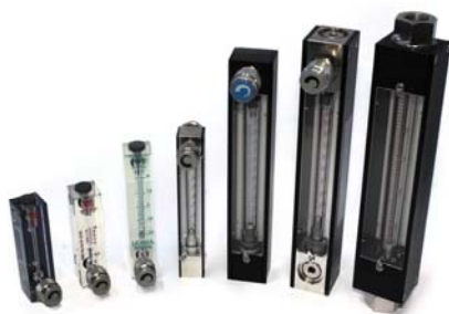
Flussimetri con differenti caratteristiche progettati ad hoc.